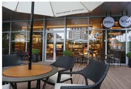
ティーやコーヒーを飲みながらゆったり読書できるBOOK&CAFE。ペットと一緒に寛げるテラス席も完備